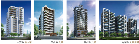
大安區 台大華 文山區 九歌 中山區 九仰 內湖區 大華湖閣