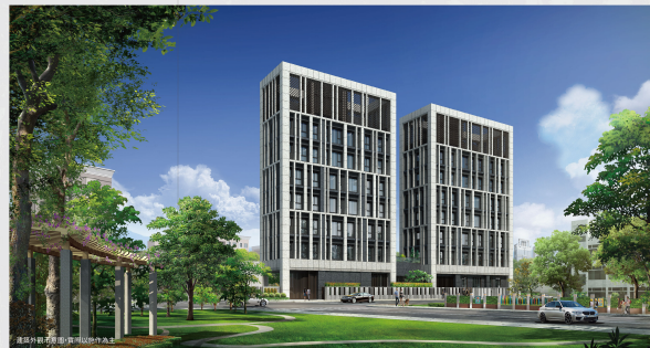
建築外觀的細節，展現出內涵