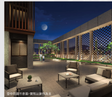
空中閣樓的客廳，實地以車行鳥瞰