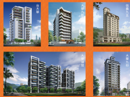
代表業績 | 內湖 大華湖濱 | 大華 台大華 中山 大華九和 | 文山 大華九歌 | 信義 信義九五