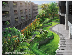
一種綠意呼喚您(實地)心動入住